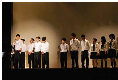
生徒会・実行委員あいさつ