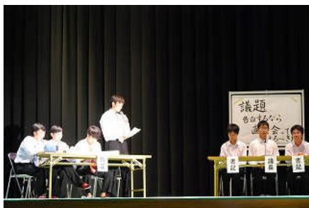
ぶちかまし討論会決勝