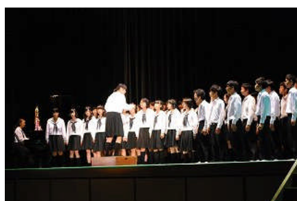
合唱コンクール優勝クラス